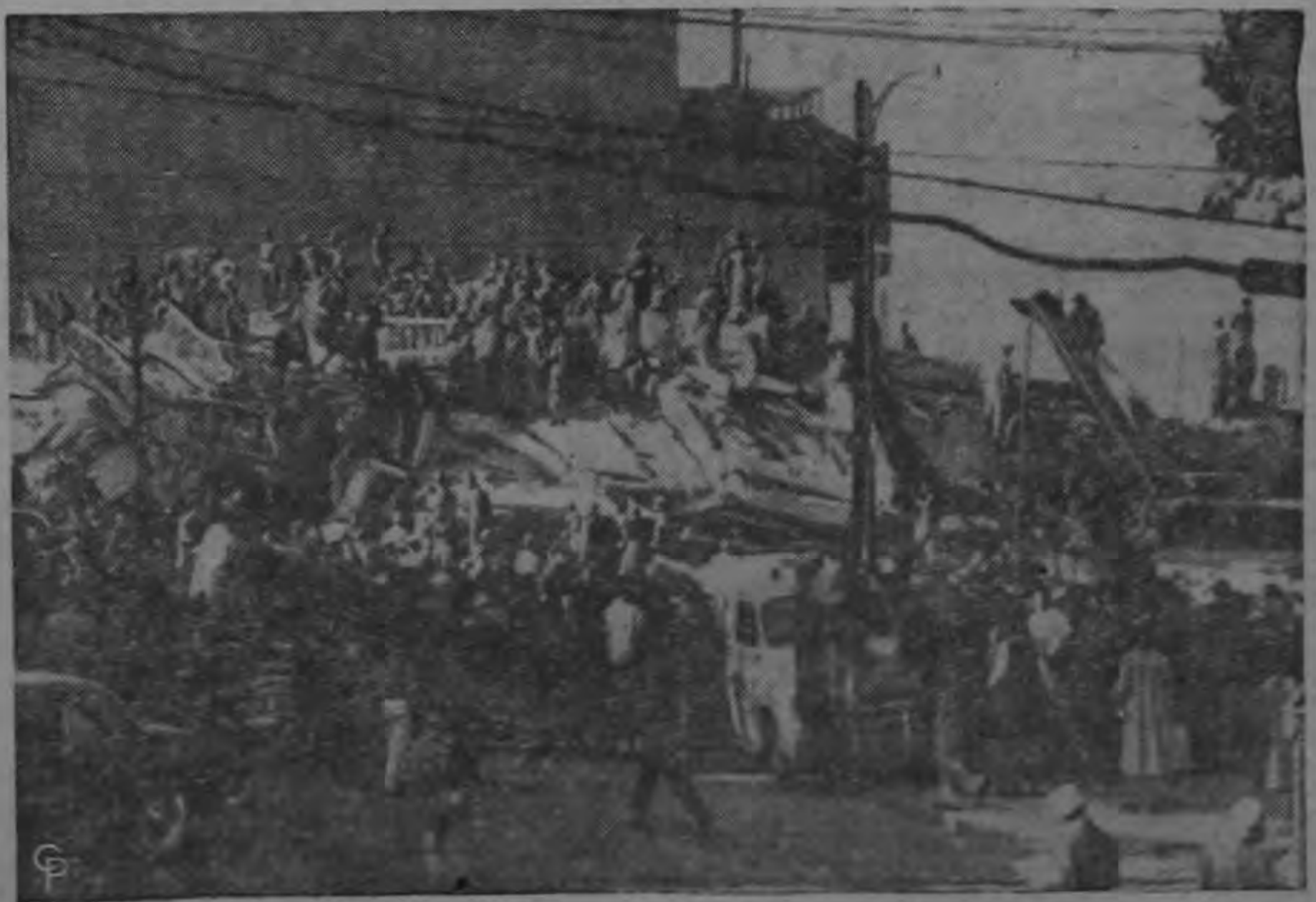
Más de 25 cadáveres fueron extraídos de las ruinas de este edificio de seis pisos, uno de los 50 destruidos por el terremoto ocurrido en Ciudad México que causó por lo menos 300 muertes y centenares de heridos. Los trabajadores de auxilio dicen que por el momento se pueden calcular el número exacto de muertos. (INP).