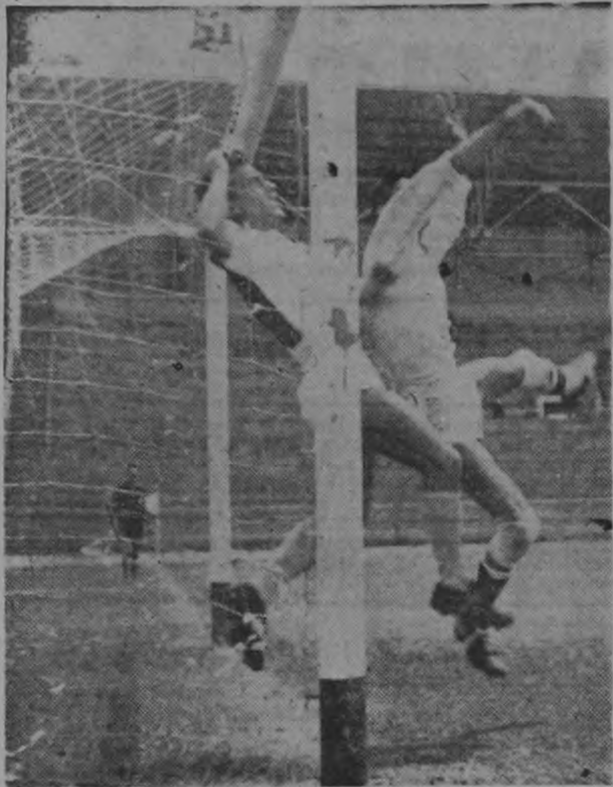
Una pelota centrada desde la punta izquierda por un artillero del equipo ramonense es rematada con éxito por un compañero para batir por el ángulo superior derecho al arquero del conjunto del Audax de Cinco Esquinas en el partido estelar de ascenso escenificado ayer en el Estadio Nacional. Al final de cuentas el cotejo terminó empatado a dos tantos.